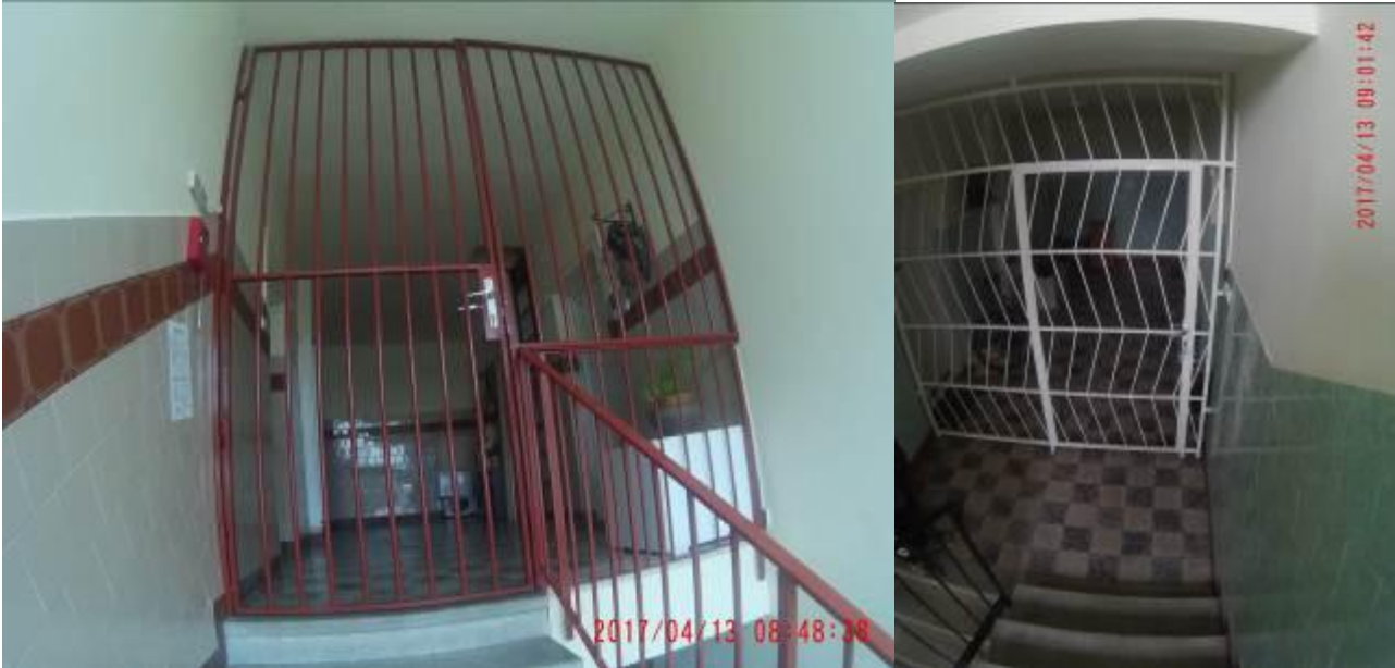
Kómúves Márk Tűzvédelmi főelőadó Okl. sz.: 197/9/2012